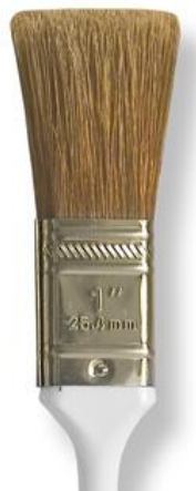
2,5cm široký štětínový štětec (zvaný 1 palcový)